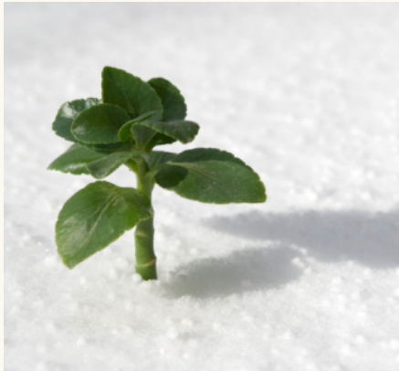
השכל ומתחיל מחדש", בהצלחה!