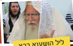
ליל הושענא רבא