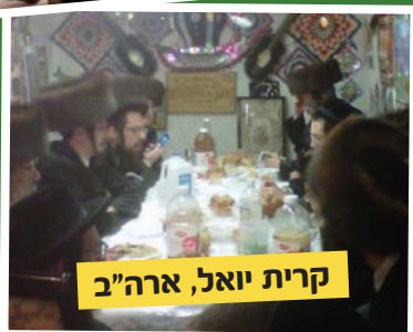
קרית יואל, ארה"ב