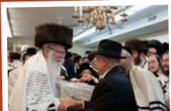
בברכת "פתקא טבא"