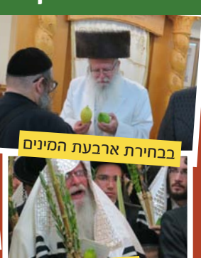
בבחירת ארבעת המינים