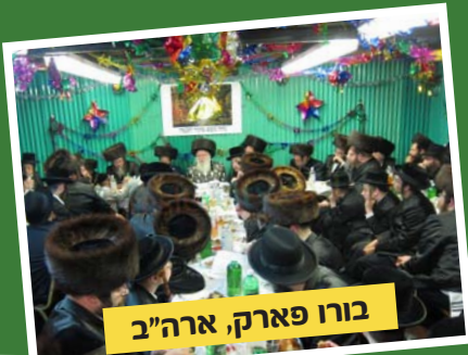
בורו פארק, ארה"ב