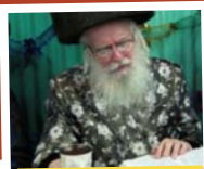
בכוס של ברכה בסוכה