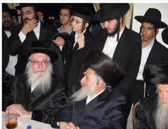
אני את מוהרא"ש ז"ל לא עוזב, עם מוהרא"ש בתחילת ההתקרבות

ונכנסתי לשם וראיתי ארון מלא ספרים: שיחות מוהרא"ש, אשר בנחל וכו', כל הספרים של בקרסלב ושל מוהרא"ש ז"ל. וראיתי שיש אוצרות, וזה ממש החיה אותי. והייתי מגיע לשם כל יום בלילה לכמה שעות.