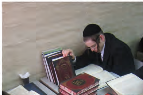
במשך תקופה קצרה גמרת את כל התורה, בלימוד שיעורים כסדרן