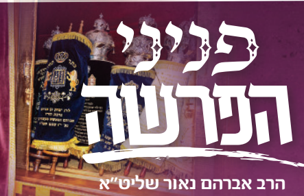
הרב אברהם נאור שליט"א