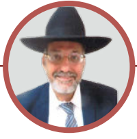
מאת הסופר דן כהן