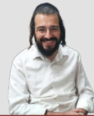
מאת הצייר: דן בר לב