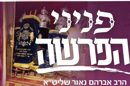
הרב אברהם נאור שליט"א