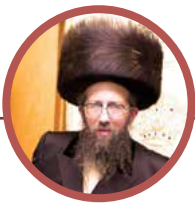
אשר בנחל חלק רכד, עמ' מה'